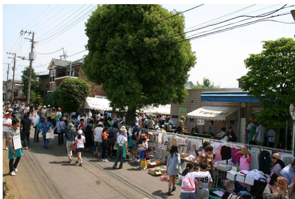
↑ 入場待ちの人の列・危険を避けて制限しつつ

さて、5月20日活動ホーム「しもだ」で第24回地域交流バザーがおこなわれました。